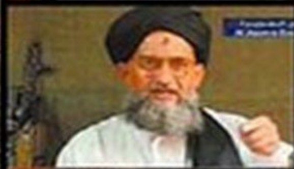
تسجيل مصور منسوب للقاعدة ويشتمن وصية لأحد منفذي تفجيرات لندن