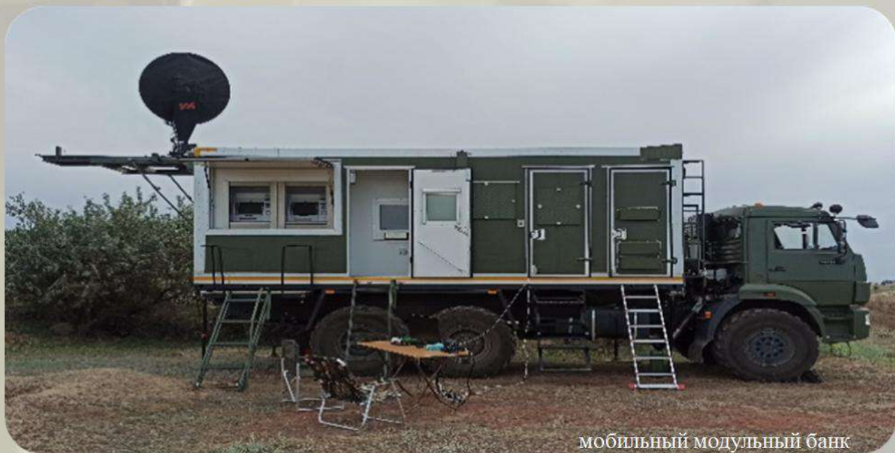
мобильный модульный банк