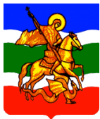
Схема теплоснабжения сельского поселения «деревня Верховье » до 2028 года

совокупной установленной тепловой мощностью в границах зоны деятельности единой теплоснабжающей организации или тепловыми сетями, к которым непосредственно подключены источники тепловой энергии с наибольшей совокупной установленной тепловой мощностью в границах зоны деятельности единой теплоснабжающей организации;