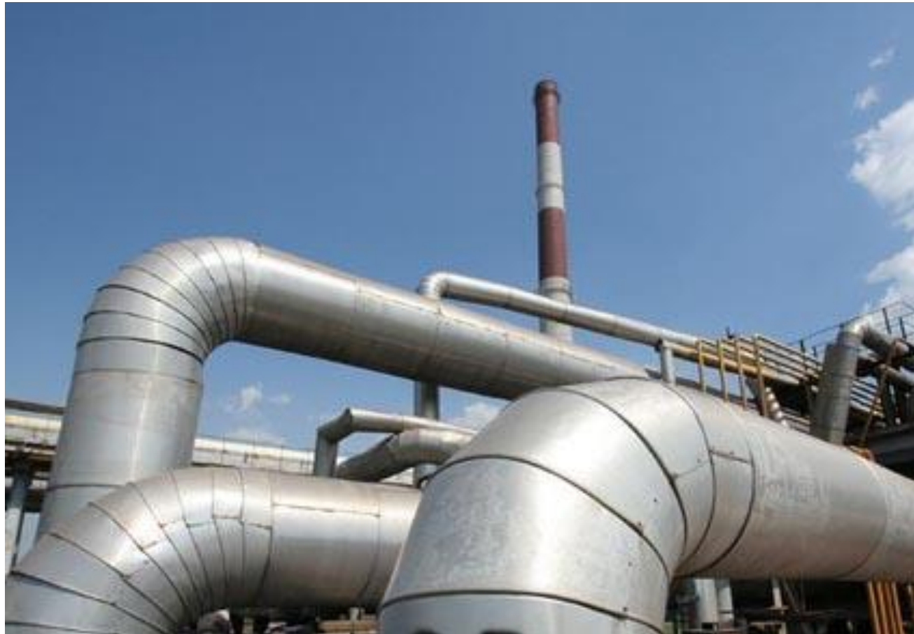
Схема теплоснабжения сельского поселения «деревня Верховье» до 2028 года

248002 г. Калуга, улица Ф. Энгельса, дом 145, оф. 9 Телефон: +7 (910) 910-36-43