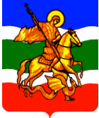
Схема теплоснабжения сельского поселения «деревня Верховье» до 2028 года