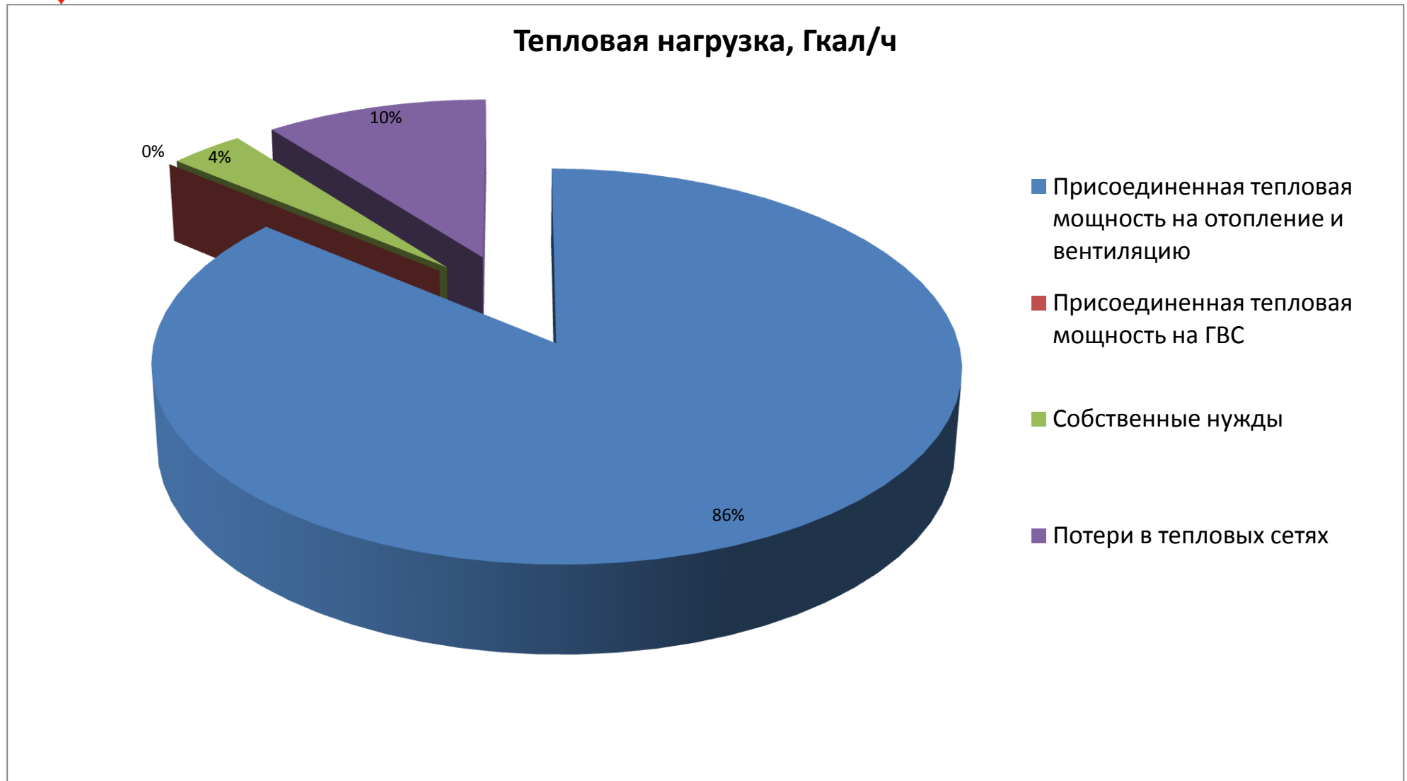
Рис. 1.4. Структура выработки тепловой энергии Котельной Верховье