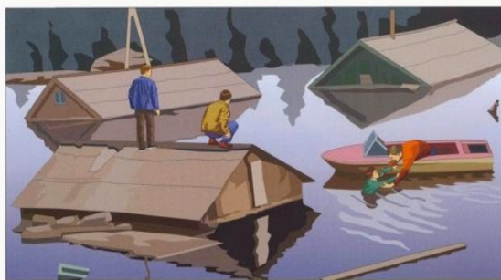
По возможности окажите срочную помощь людям, очутившимся в воде