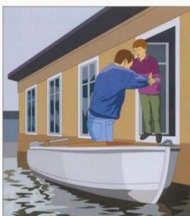
Эвакуируйтесь из опасных районов. В первую очередь из зоны затопления необходимо вывести детей