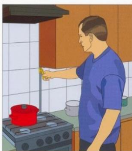
Выключите газ, электричество, нагревательные приборы