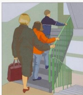
Поднимитесь на верхние этажи, перенесите продовольствие, ценные вещи, одежду, обувь