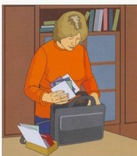
Возьмите документы, деньги, ценности и самые необходимые вещи