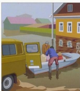
Приготовьте имеющиеся плавсредства