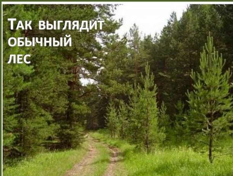
ТАК ВЫГЛЯДИТ ОБЫЧНЫЙ ЛЕС