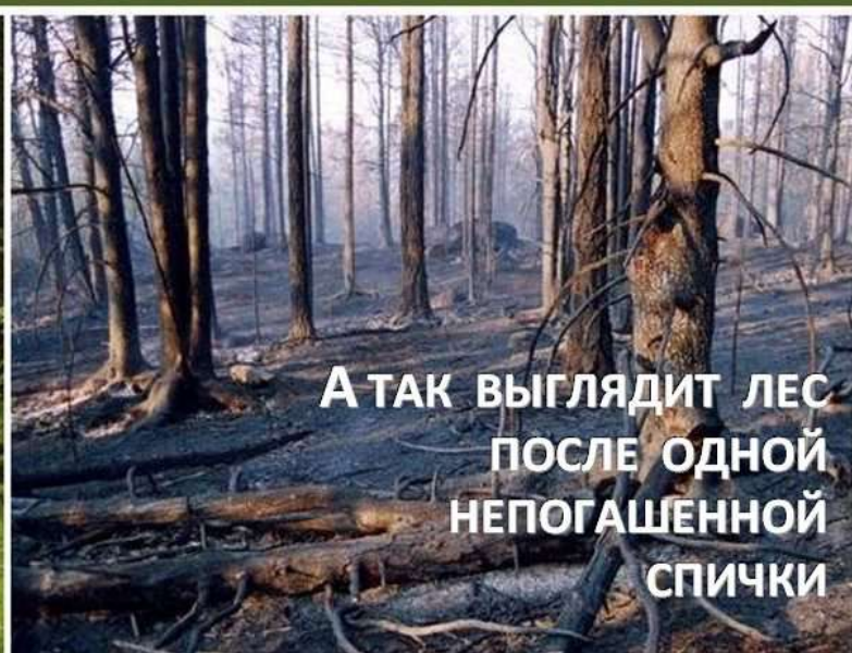
А ТАК ВЫГЛЯДИТ ЛЕС ПОСЛЕ ОДНОЙ НЕПОГАШЕННОЙ СПИЧКИ

СОБЛЮДАЙТЕ ПРАВИЛА ПОЖАРНОЙ БЕЗОПАСНОСТИ В ЛЕСУ